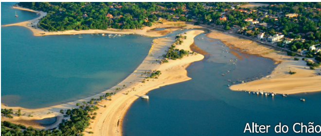
Alter do Chão