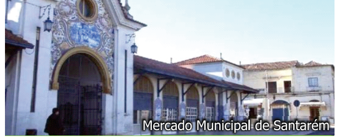
Mercado Municipal de Santarém